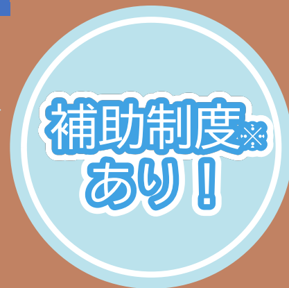
※雨水浸透ますのみ